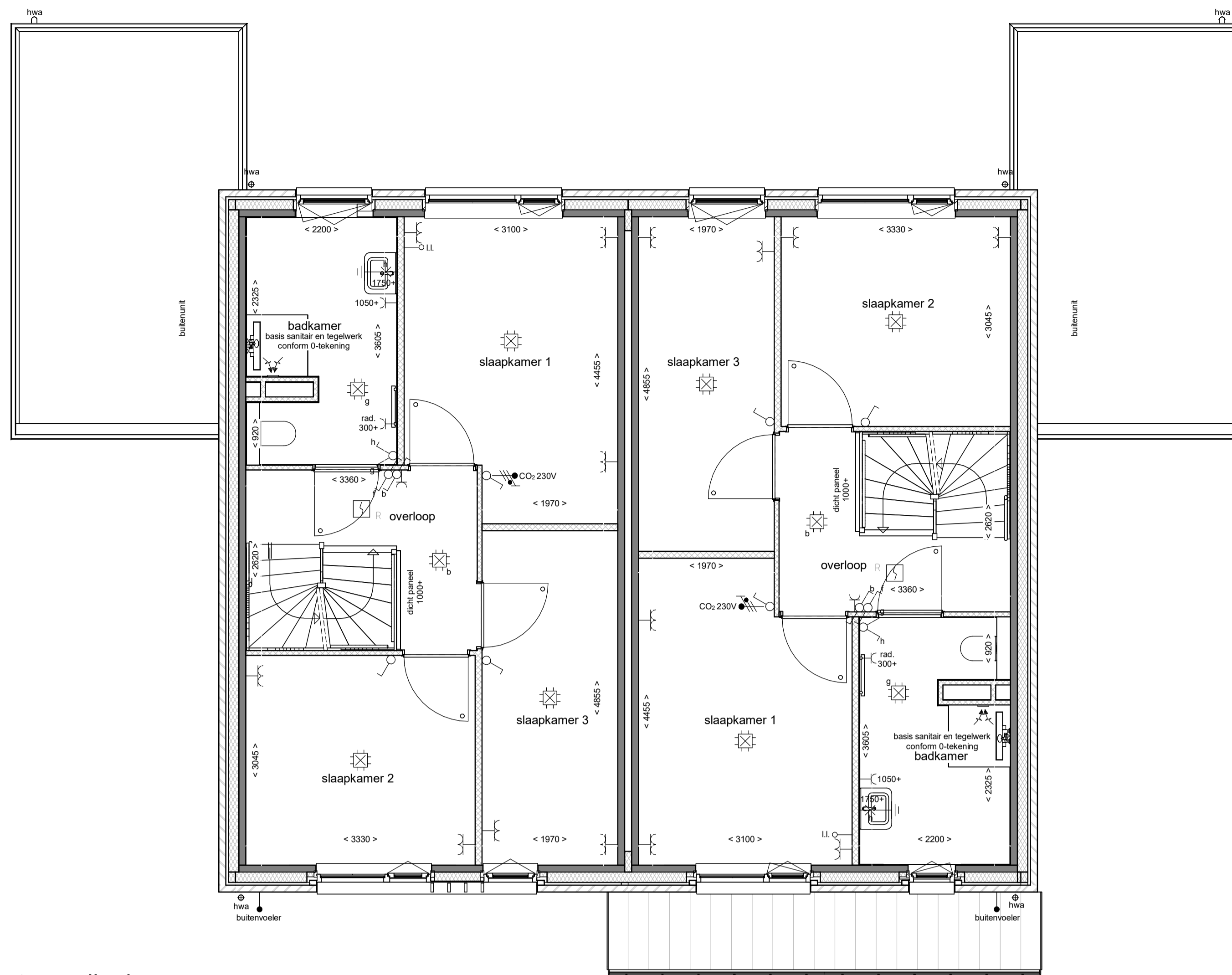
eerste verdieping schaal 1 : 50