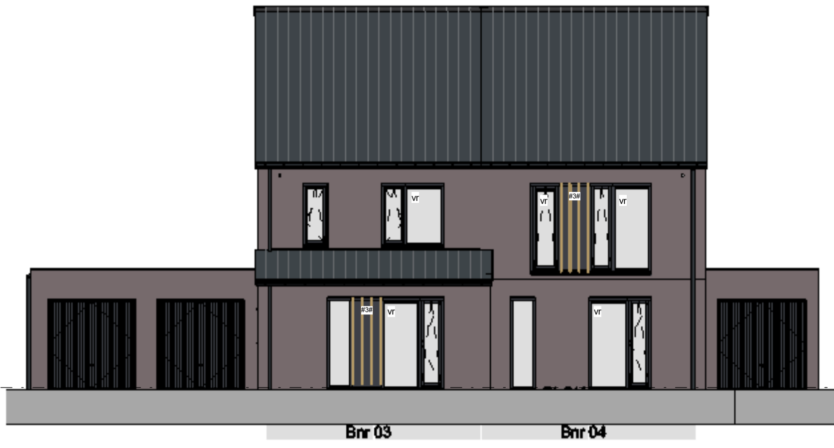
voorgevel schaal 1 : 100