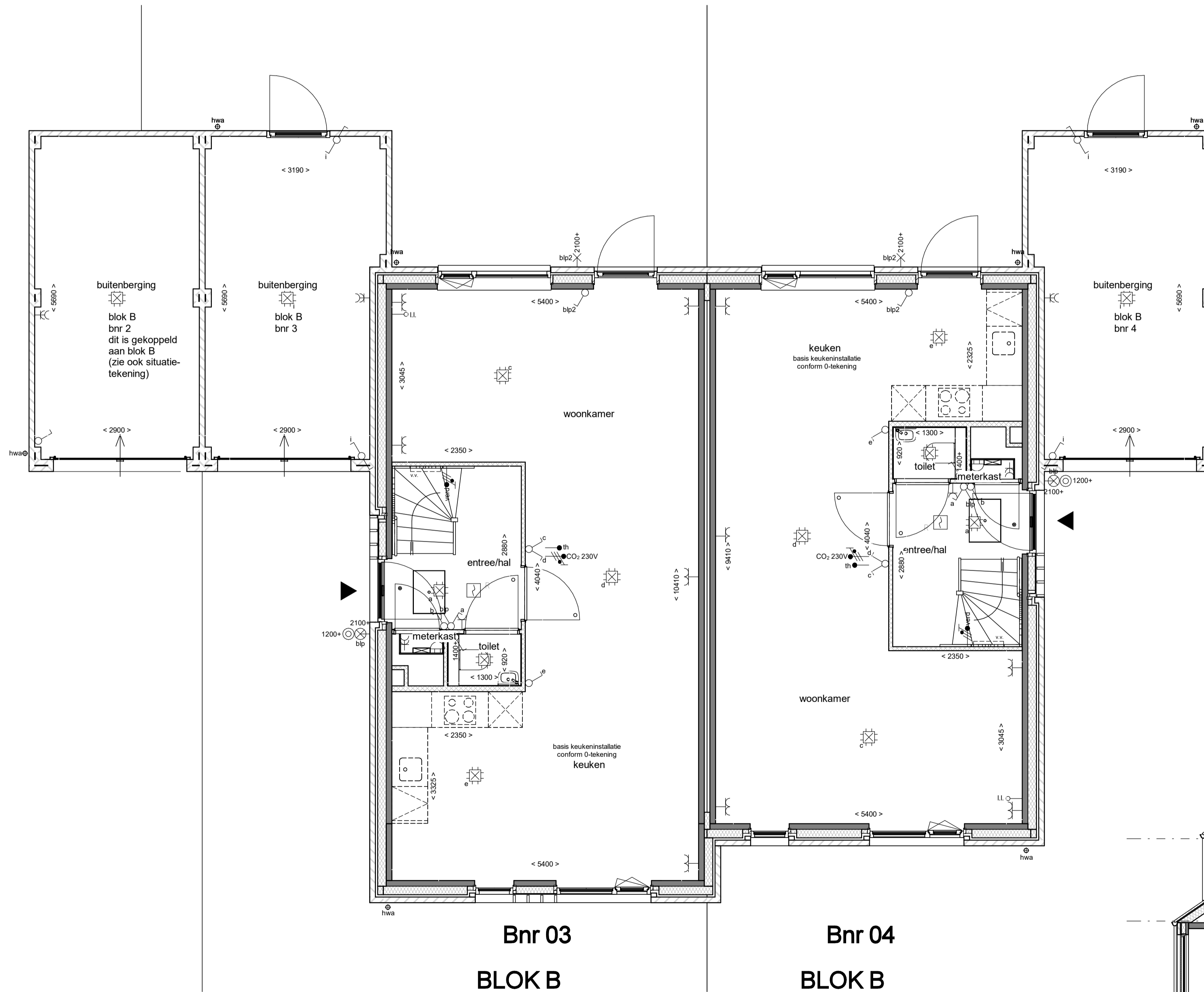
Bnr 03 BLOK B