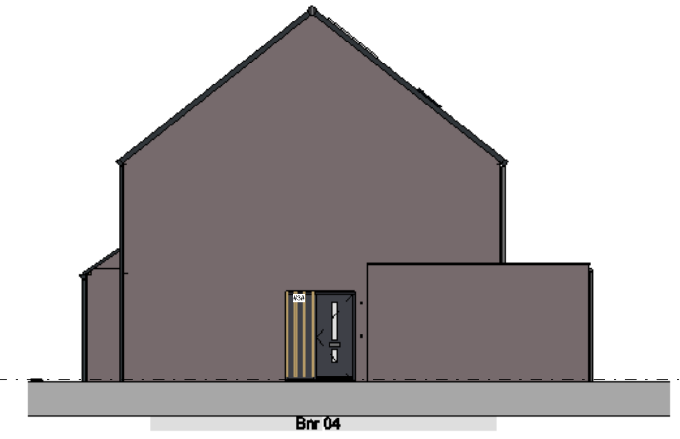
rechter zijgevel schaal 1 : 100