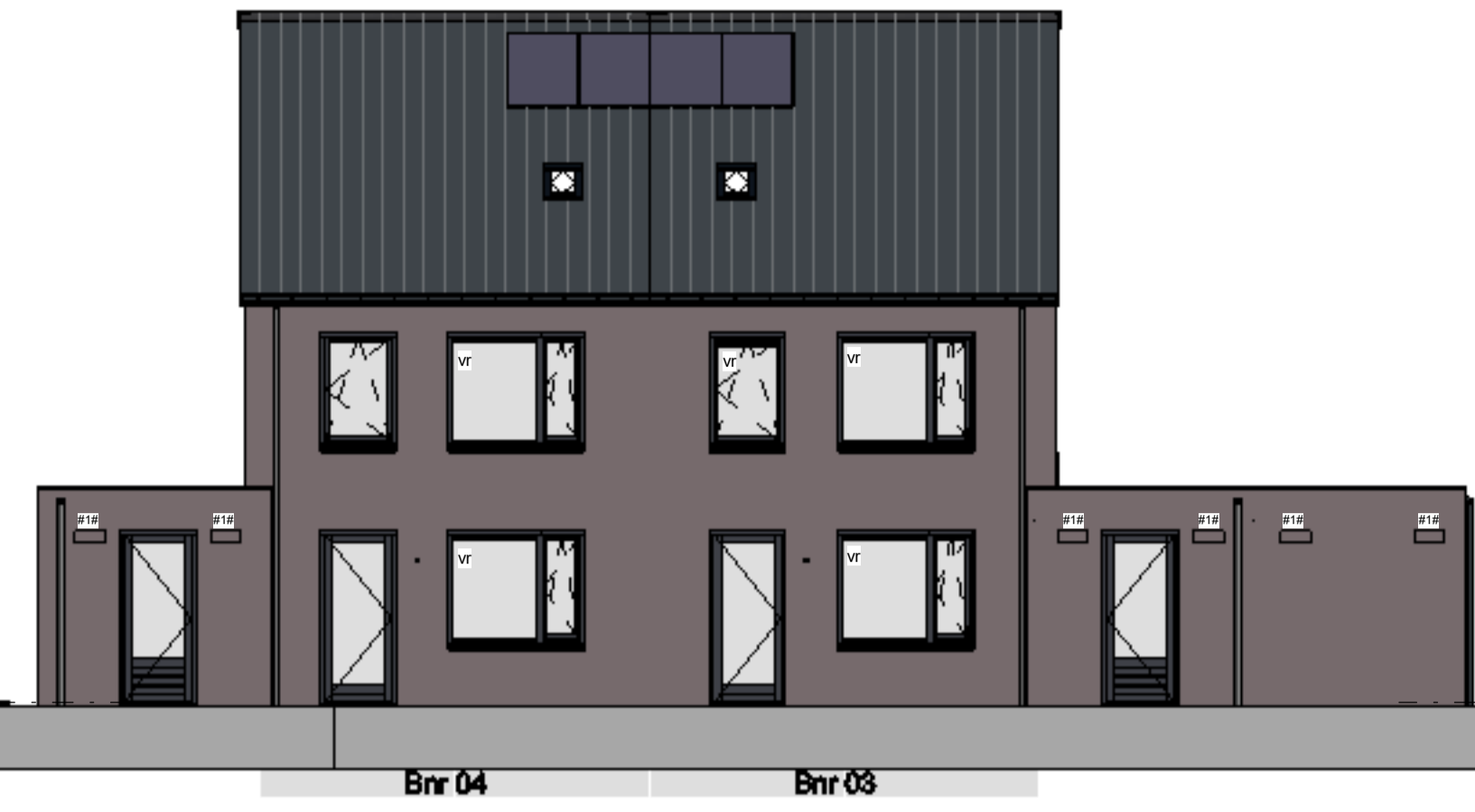
achtergevel schaal 1 : 100