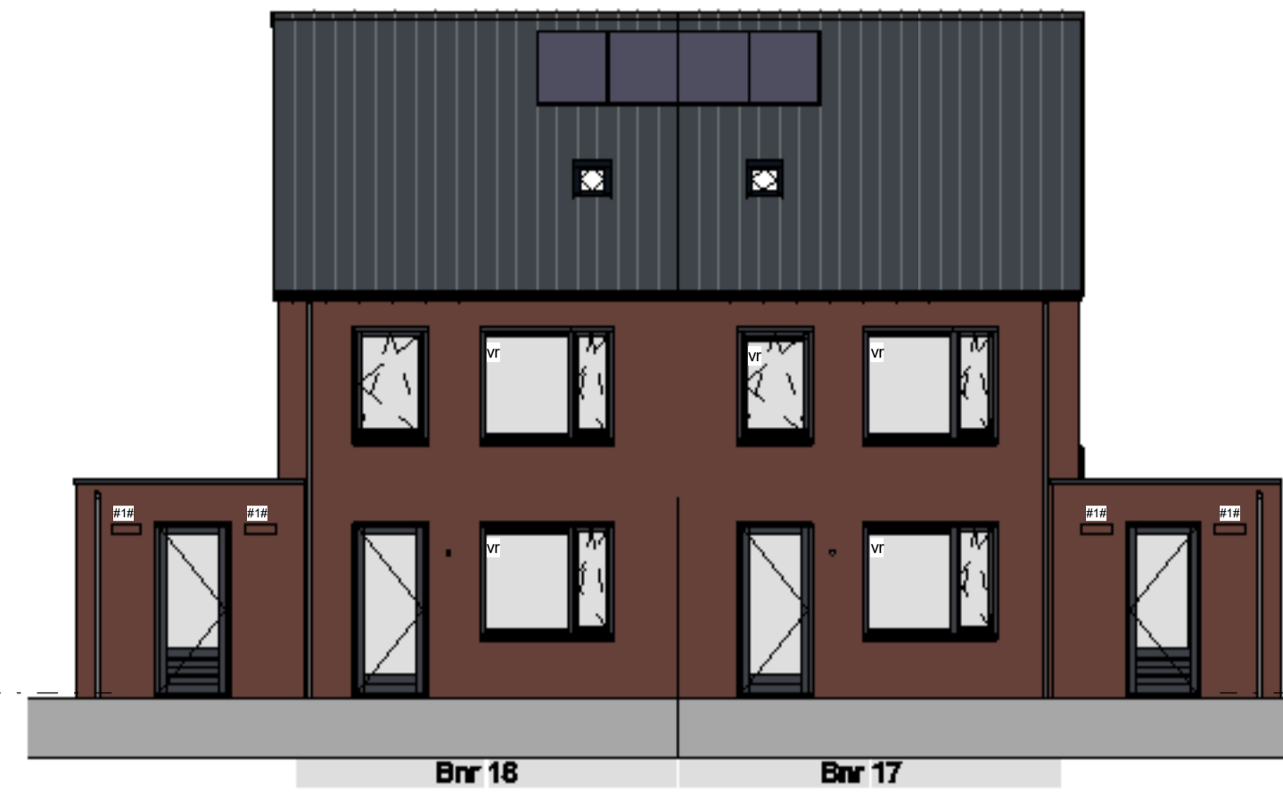
achtergevel schaal 1 : 100