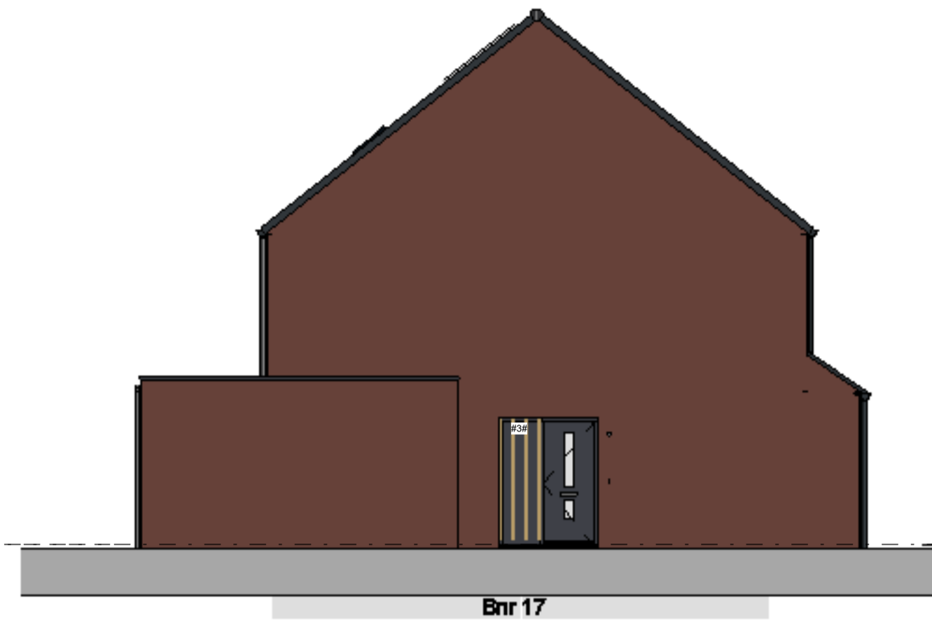
linker zijgevel schaal 1 : 100