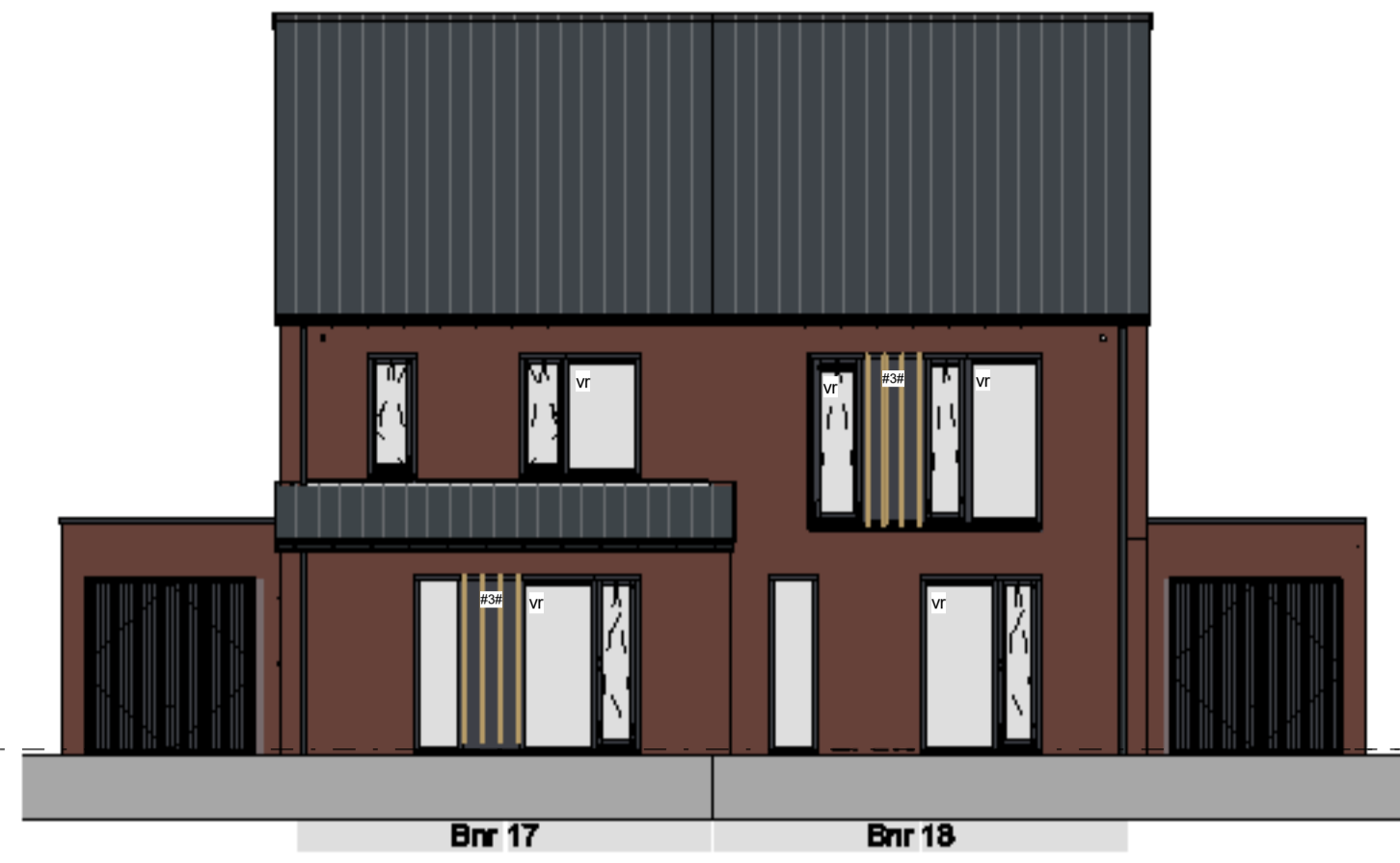
voorgevel schaal 1 : 100