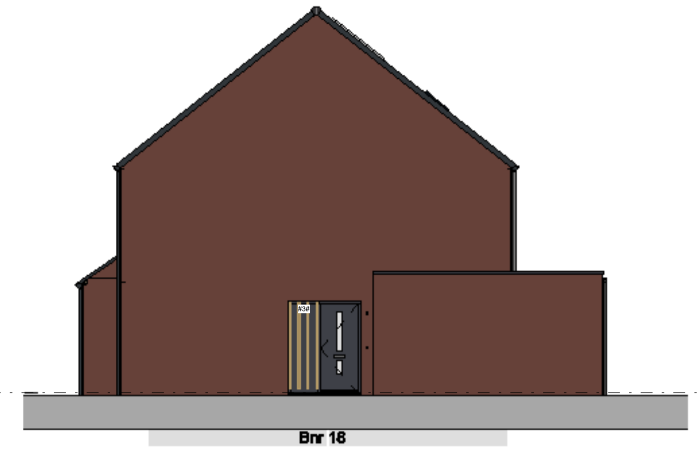
rechter zijgevel schaal 1 : 100